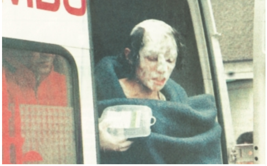
Haykırıyordu bir kadın devrimci tutsak: “Bizi diri diri yaktılar!”

hücre tipi cezaevleriyle çözmeye yöneltiler. Özellikle son on yılda bu yönlü bir dizi proje üretildi. Sonuçta Terörle Mücadele Yasası denilen bir yasa hazırlandı. Devrimci hareketi devlet terörüyle boğmanın, devrimcileri imha etmenin, devrimci halk hareketine kapsamlı saldırılar düzenlemenin vb. vb. yasal altyapısını oluşturan bu yasayla devrimcilerin cezaevlerinde “hücrelere” konmasına da olanak tanınıyordu. Cezaevlerinde yaşamın hücreleştirilmesi saldırısı ile devlet devrimci tutuklu ve hükümlülere yalnızlaştırmayı, devrimci tutuklu ve hükümlülerin devletin saldırılarına karşı birlikte hareket etmelerini engellemeyi, onları hücrelerde psikolojik yıldıрма hareketiyle tam teslim almayı planlıyordu.