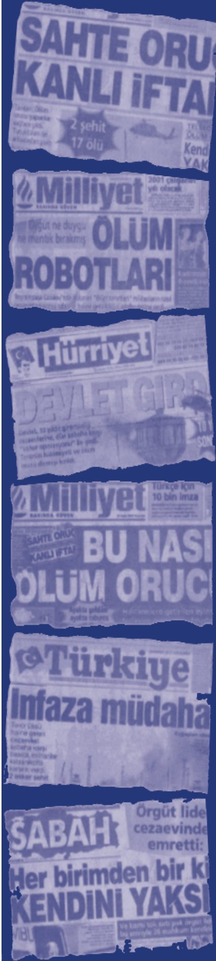
Mehmetçik basın cezaevlerinde devrimciler katledilirken yalanlarıyla iş başındaydı!

yapımı tamamen bitmeyen F tipi cezaevlerine konuldu. Hem de boş cezaevi olmadığı gerekçesiyle!