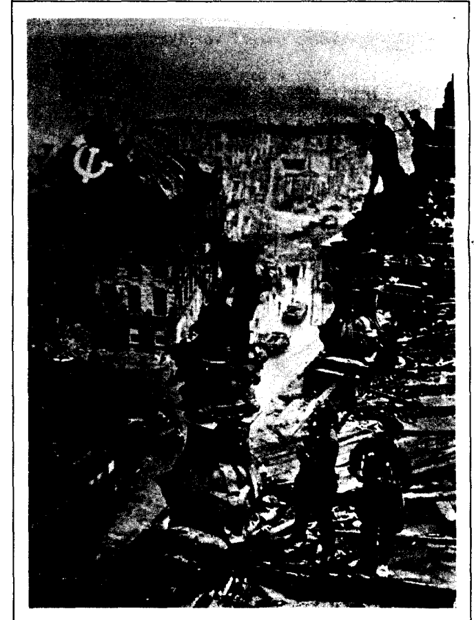
Kızılordu askerleri Berlin'de Reichstag binasına kızıl bayrak dikerlerken

İşte bu sebeplerden kapitalist dünya ekonomisi sisteminin birinci buhranı sonucu I. dünya savaşı; ikinci buhranı sonucu 2. dün