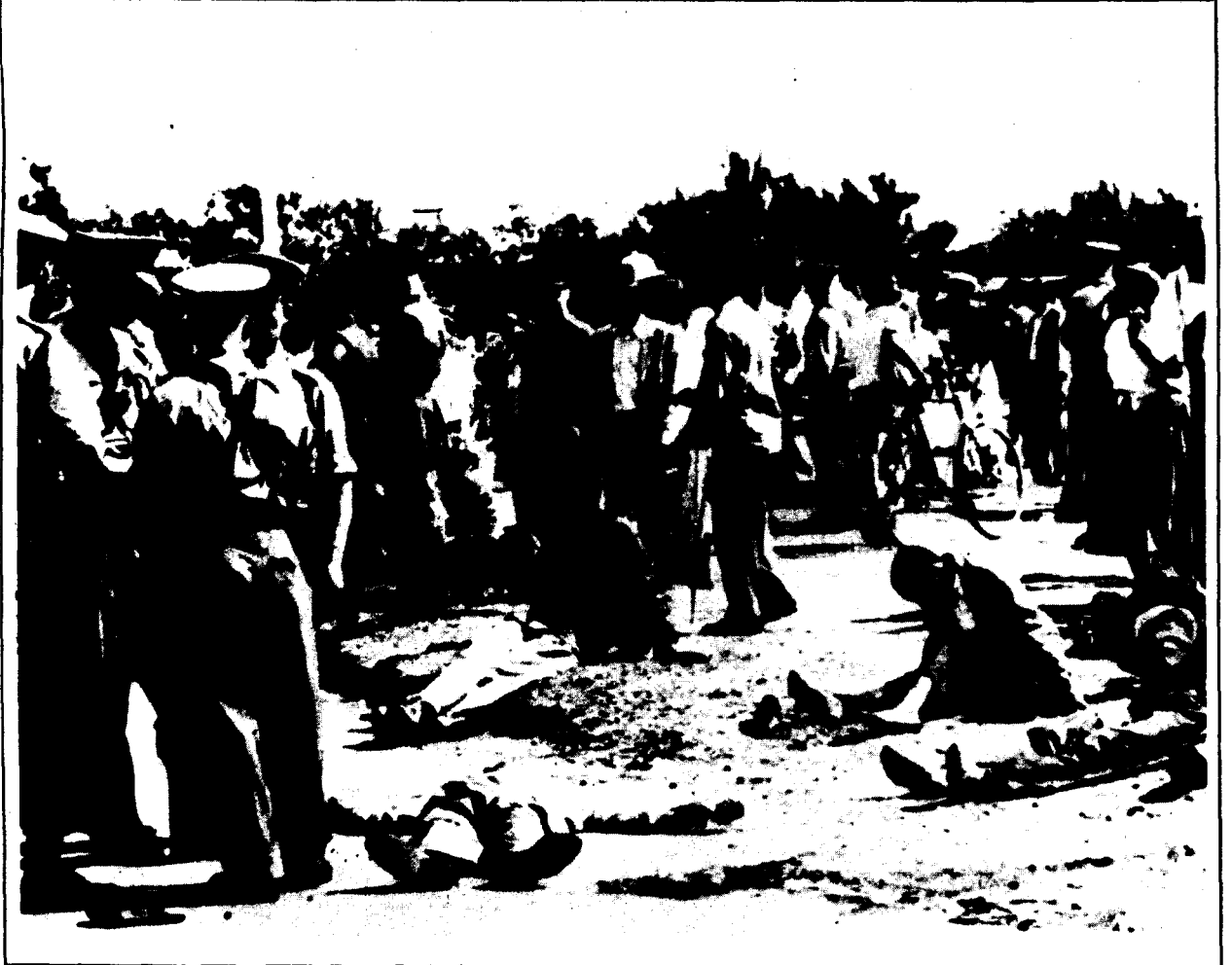
1960 Sharpville katliamı. Resmi bilgilere göre polis, 20 000 Siyahın yaptığı gösteriler sırasında 69 kişiyi katletti.

Beyaz ırkçıların taviz vermezliğine bağlı olarak, ANC 1969 yılında, gerilla mücadelesinin başlamasına ilişkin hazır-