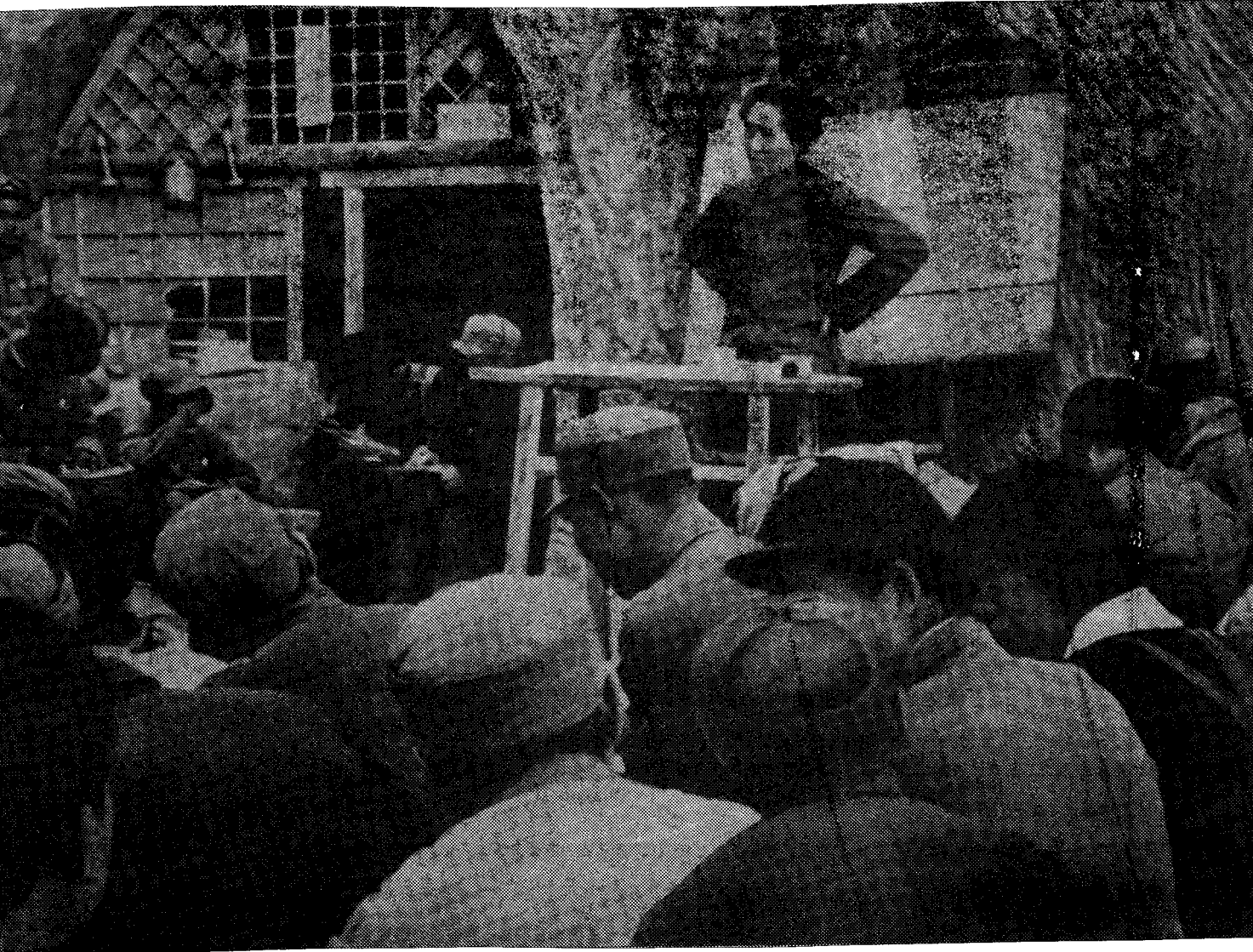
Mao Zedung Mayıs 1938'de Yenan'da konuşurken